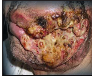
FUMER CAUSE LE CANCER DE LA BOUCHE