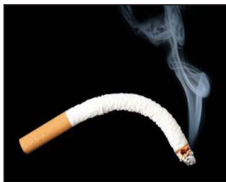
Tobacco use makes you impotent