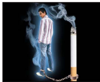
Cigarette is a highly addictive drug