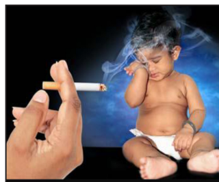
Tobacco smoke harms the health of children