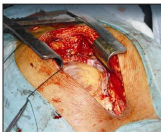
FUMER PROVOQUE LES MALADIES DU COEUR