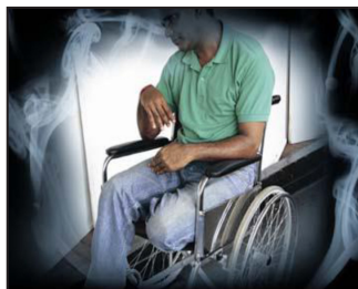
Smoking causes strokes