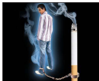
LA CIGARETTE EST UNE DROGUE QUI CRÉE UNE FORTE DÉPENDANCE