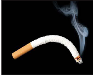
L'USAGE DU TABAC PROVOQUE L'IMPUISSANCE SEXUELLE