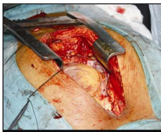
Smoking causes heart diseases