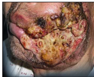
Smoking causes mouth cancer