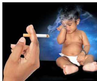
LA FUMÉE DU TABAC NUIT À LA SANTÉ DE L'ENFANT