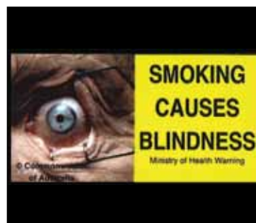
Предупредительная надпись, Новая Зеландия