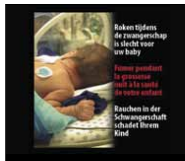
Предупредительная надпись, Бельгия