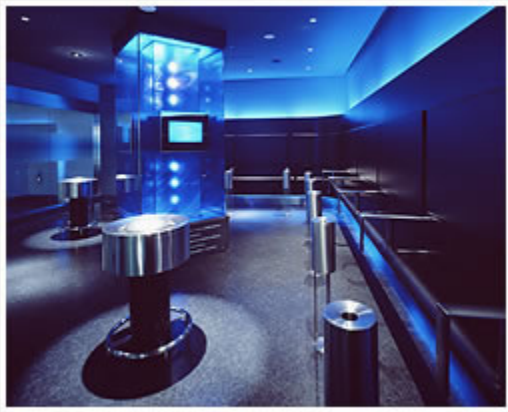
在日本最繁忙的东京羽田机场的吸烟点（2007年） 70

的机场（2007年） 68 推出了吸烟室。菲利普·莫里斯公司在日本直接与日本通风系统制造商沟通，显然是为了评估通风系统 69 。