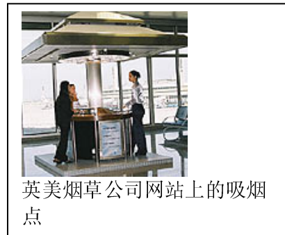
英美烟草公司网站上的吸烟点

2007年，日本烟草国际公司“设置了200多个玻璃的室外吸烟室，包括服务员、洗手间和烟灰缸” 64 ，到2008年底，该公司计划在“15个国际机场”引入通风的吸烟区，包括“46个吸烟室，70个吸烟小屋，以及60多个吸烟点” 65 。日本烟草国际公司在日本成田国际机场（2006年） 66 、日本北海道札幌新千岁机场（2003年） 67 和日本东京羽田最繁忙