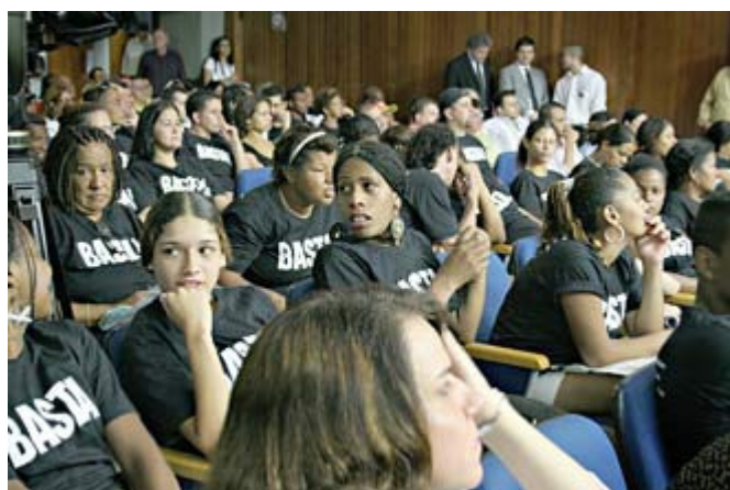
烟草业在巴西圣保罗组织的抗议者。T 恤衫上写着“够了” 37