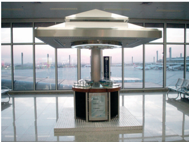
英美烟草公司设在巴西的“吸烟点”，2004年 63

烟草业及其同盟者提倡的机械换风技术包括房间通风系统，“吸烟点”（在周围无烟的区域设置的通风的吸烟者台子），和吸烟座席。